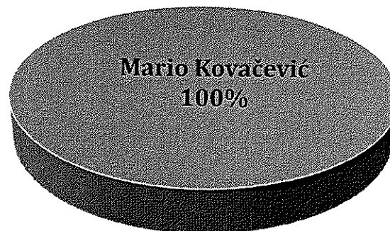
Vlasnička struktura prije i nakon mjera restrukturiranja